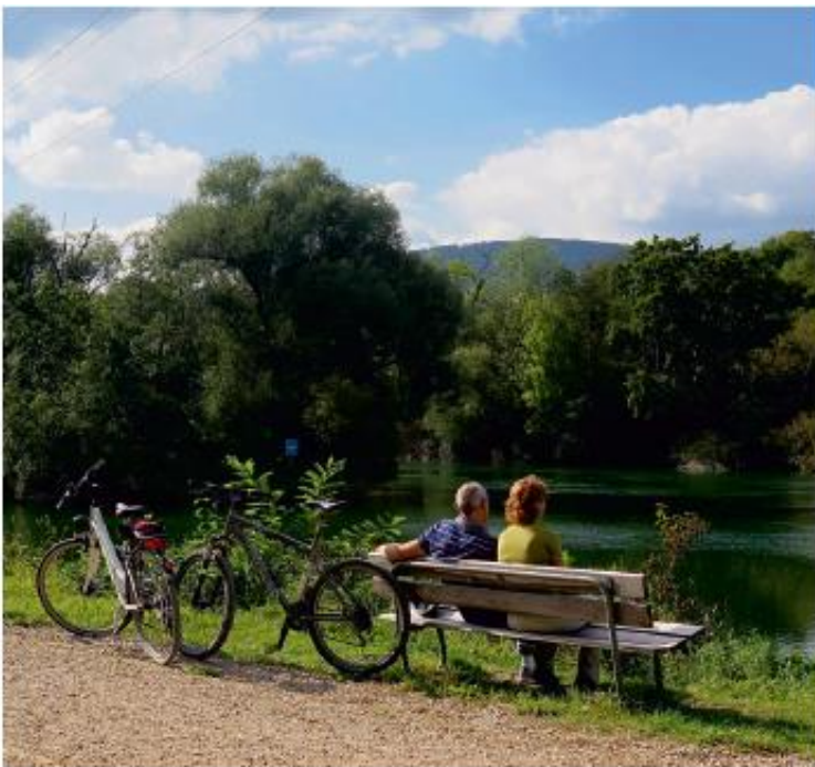
Naturnahe Fließgewässer sind für einen sanften Fahrradtourismus sehr attraktiv.

Oftmals ergänzen sich zum Beispiel die Ziele von Wasserwirtschaft, Naturschutz, Tourismus und Landschaftspflege. Renaturierte Gewässer haben nicht nur eine hohe Anziehungskraft für Erholungssuchende, sondern sind auch für den Tourismus attraktiv. Touristische Kernthemen wie „Wasserwandern“ oder „Naturpark Flusslandschaft“ können entscheidende regional-wirtschaftliche Impulse setzen.